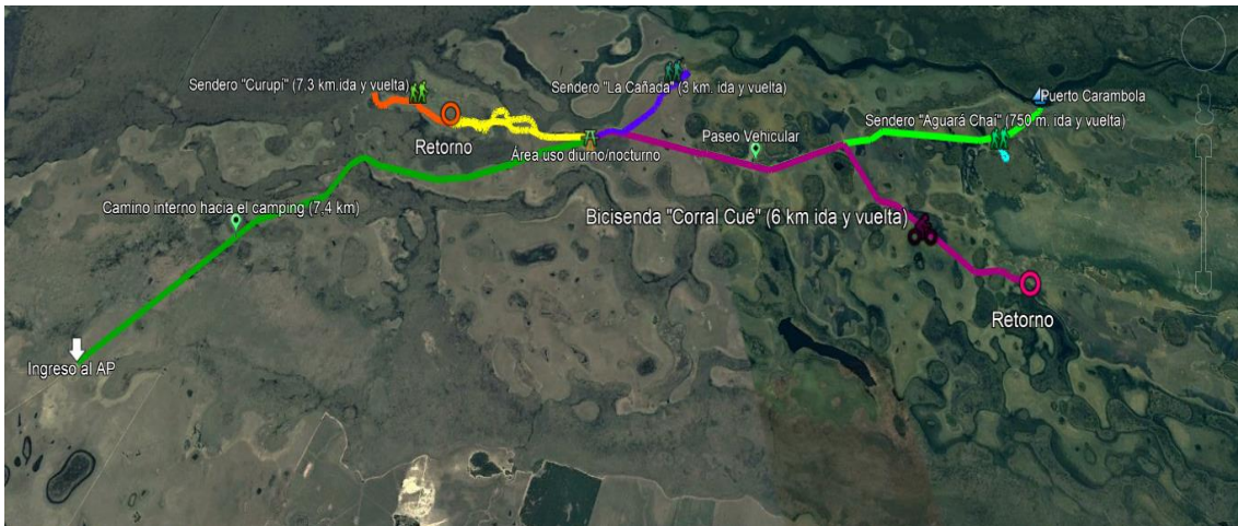
Mapa N° 3: Portal San Nicolás – Área de uso público intensivo