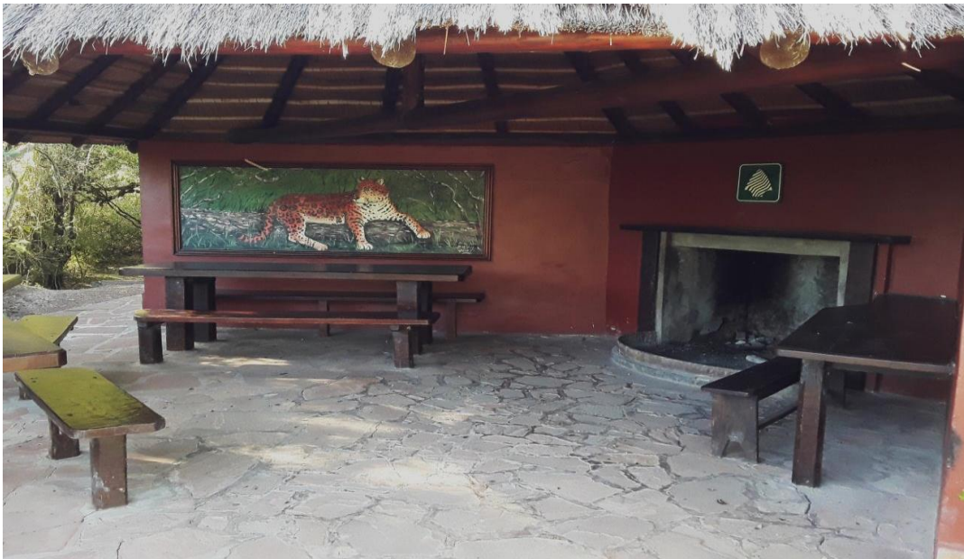
Foto N° 1: Portal Laguna Iberá – Quincho “Matera”, lugar de registro obligatorio antes de recorrer senderos.