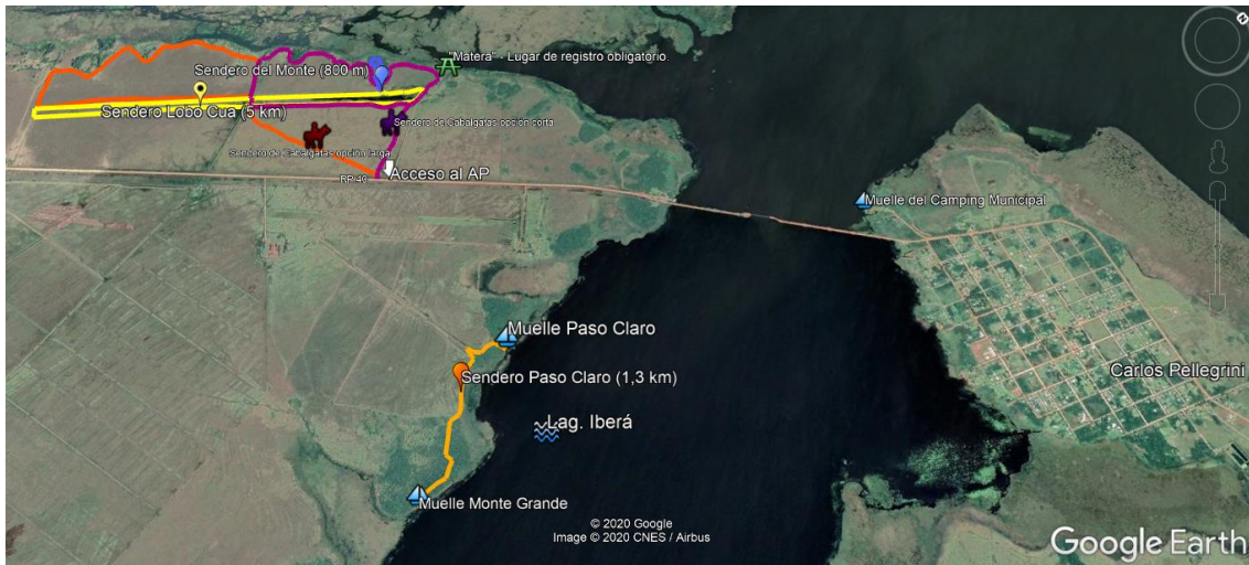
Mapa N° 4: Portal Laguna Iberá – Área de uso público intensivo.